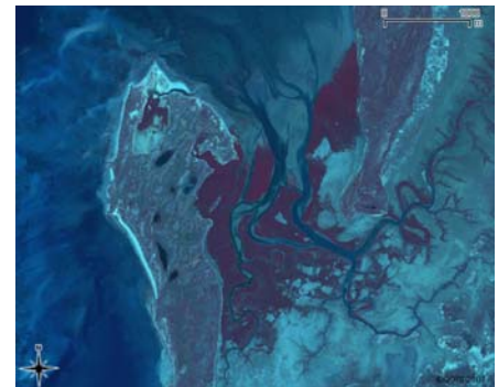
Amboaran-tsary avy amin'ny zana-bolana ao amin'ny faritry Belavenoke

Tamin'ny fararano farany teo, Ny Blue Ventures dia nanangona ny antonta-kevitra fototra momba ny ala honko tao Belavenoke, tanàna any Atsimo Andrefan'ny Madagasikara, mba entina hanaovana ny tombanezaky ny rafitry ny ala sy hamaritana ny sanda ara-toekarena ny ala honko eo amin'ny mponina any an-toerana – izay mety mitondra risika amin'ny fitantanana ny ala honko tontosain'ny mponina.