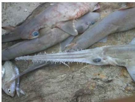
Ny antsantsa azo ary araha-maso ao antin'ny Fandaharanasan'ny BV momba ny Antsantsa sy ny Sokatra.

Ny sarin'ny antsantsa roa azo tamin'ny volana aprily 2007 no nahafahana namantatra ny karazany izy ireo. Ny antsantsa dia fantatra fa Pliotrema warreni , ny antsantsa izay manana hirika amin'ny sofiny 12 (milahatra tsiroaroa) ny an'ny rehetra dia 10. Ny Pliotrema warreni dia "endémique" amin'ny Atsimon'ny Afrika, izay voafaritra ihany ny haitoetany ahitana azy. Fantatra fa any amin'ny Oseana Indiana Andrefana, lavitra ny Madagasikara no misy azy, ary any atsimon'ny Mozambika ka hatrany amin'ny Cap Aulhas, Afrika Atsimo, izay manana halalin-drano eo amin'ny 37m ka hatramin'ny 500 m.