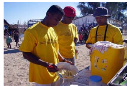
Ny mpiasan'ny ADES dia miasa ao Andavadoaka mampiseho ny fatana.

Ny tetikasa BVCO dia mbola manohy ny asa fanenana ny marika karbôna miaraka amin'ny mpandraharaha sy ny olon-tsotra. Ny mpanoro-hevitra miaraka amin'ny BVCO dia nikajy ny marika karbôna ataon'olon-tsotra na ny mpandraharaha ary namolavola fomba tsotra hanampy amin'ny fanenana an'izany. Ny BVCO dia manampy amin'ny fanenana ny marika eny amin'ny tontolo iainana noho ny asa fandrarahana na ny asan'olon-tsotra fa manampy ihany koa amin'ny fanenana ny sandany. Azonao atao ny mifandray amin'i Ellie ellie@blueventures.org raha hiara-hiasa amin'ny fanenana ny marika karbôna vokatry ny asanao ianao ary manomboha mamolavola drafitra hitantanana ny karbôna.