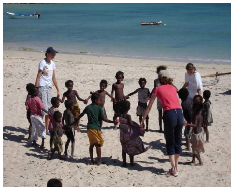
Ny mpiasa an-tsitrapo tao amin'ny Blue Ventures dia nitantana akanin-jaza, hampilalaoana ny ankizy eo am-piandrasana ny reniny mitsidika ny toeram-pitsaboana.

Hill no nandimby an'i Craig Noler, izay nandao an'Andavadoaka rehefa avy niasa tao mandritry ny 9 volana. Ny fiheretam-pony sy ny fanoloran-tenan'ity farany izay tsy nisy fetra dia ho tsaroana foana.