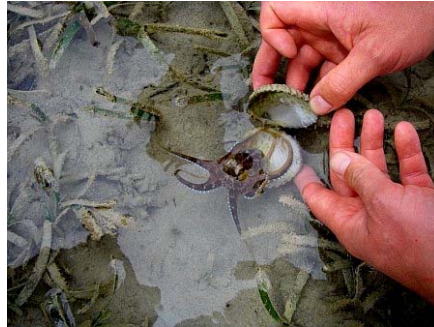
Ny ahidrano dia toeram-ponenana manandanja tokoa eo anelanelan'ny ala honko sy ny vatohara

Ny tongoan'ahidrano tahaka ny ala honko dia tena zava-dehibe tokoa amin'ny fitazomana ny vatohara ho salama ary manasivana ny herin-kanina, ny antsanga ary ny contaminants