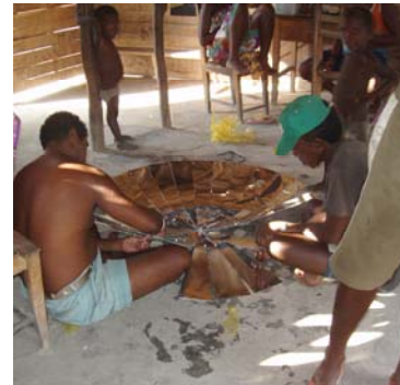
Ny ekipan'ny BVCO dia manofana ny tokenrano hanamboatra fatana mibilo-tsoritra na "parabôlika"

Satria ny fatana mandeha amin'ny herin'ny masoandro dia tsy azo ampiasaina foana (100%) noho ny toetry ny andro, ny fatana Yoyo dia nampidirina mba hifameno amin'ny fampiasana izany fatana izany.