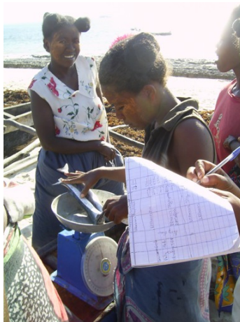
Ny vehivavy any an-toerana dia mitantana ny fandaharanasa momba ny fanaraha-maso ny trondro misy vombony.

Tristan mba hanombohany ny asa fanaraha-maso tena izy.