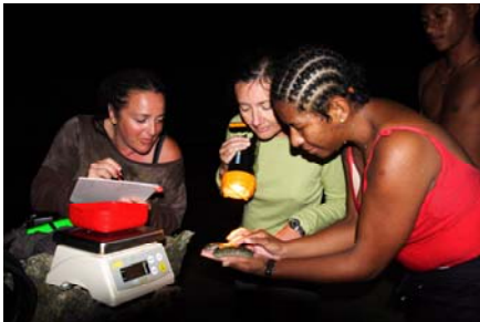
Ny mpiasa an-tsitraro no manao fanarahamaso ny fitombon'ny zanga amin'ny feno-manana

Ny tetikasa fakan-tahaka dia natsangana tao Antseragnaso, toerana akai-kin'Andavadoaka, izay nananganan'ny Fikambanam-behivavy vala mirefy 10m x 6m ary nitehirizana zanga madinika avy amin'ilay karazana Holothuria scabra vao foy avy amin'ny Aqualab. Ny fanarahamaso ny fahavelomany sy ny taham-pitomboany no tontosain'ny mpiasa antsitraro ao amin'ny Blue Ventures indray mandeha isam-bolana miaraka amin'ny Fikambanam-behivavy, izay tompon'andraikitra ny fitombony, ny fikarakarana sy ny fiandrasana ny vala.