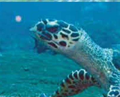
Tortue de mer