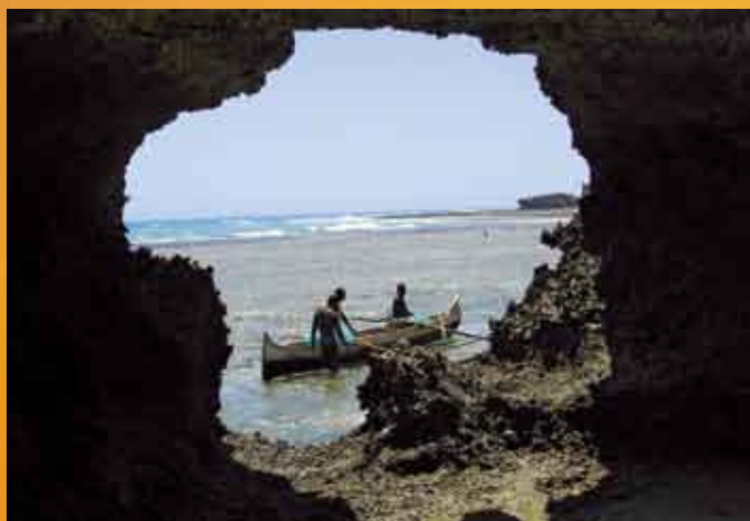
Grotte des pêcheurs.

Les dimensions de la pirogue vezo varient selon l'utilisation. 2 m pour la pêche à la ligne et jusqu'à 8 m pour le transport et la pêche au filet.