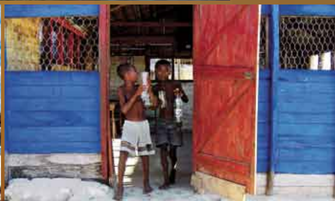
Enfants à Andavadoaka.