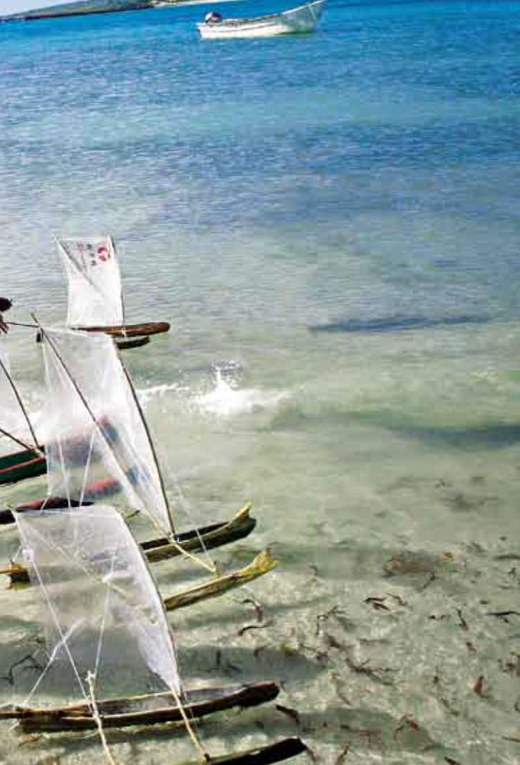
Les enfants Vezo s'entraînent et jouent avec leurs petites pirogues.