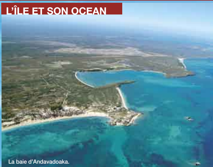
La baie d'Andavadoaka.

La région des vezo du sud de Madagascar est réputée pour la qualité de ses poulpes. L'augmentation des prélèvements notamment à cause de l'arrivée des collecteurs a provoqué la diminution des réserves. Les poulpes connaissent une forte demande sur le marché international provoquant une hausse des prix qui atteignent aujourd'hui 1500 ariary le kilo. Pour répondre à la demande les pêcheurs ont tendance à utiliser tous les moyens pour capturer le plus possible de poulpes. Ils vont même jusqu'à empoisonner des secteurs de pêche avec une plante l'" euphorbia laro ". La surpêche a justifié le démarrage d'une étude scientifique afin de pérenniser la survie des poulpes. Une gestion des ressources a été mise en place. Actuellement, seules les céphalopodes pesant plus de 350g sont acceptés à la vente. Trois réserves marines de poulpes ont été créées par les villageois en collaboration avec l'ONG BLUE VENTURES à Ampisorona, Nosy Fasy, Nosy Masay et la société COPEFRITO, l'un des collecteurs de poulpes. La pêche a été limitée à 5 mois dans l'année.