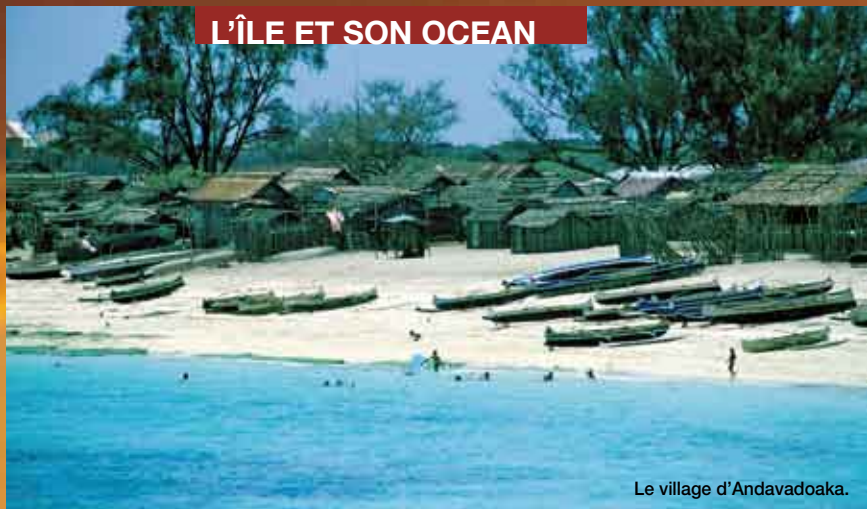
Le village d'Andavadoaka.