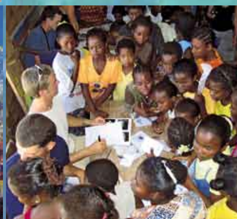
Sensibilisation des plus jeunes.