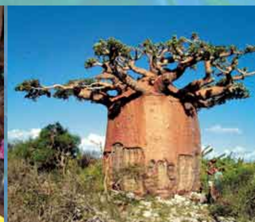
Baobab à Andavadoaka.